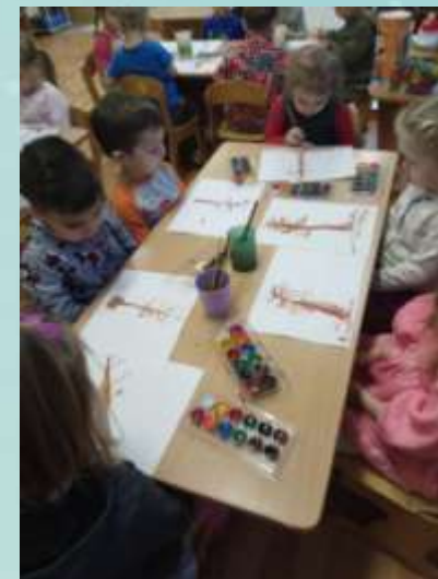
Рисование: «Дерево зимой».