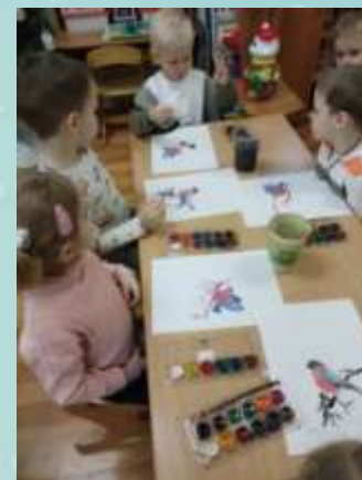
Рисование: «Снегири на ветке».