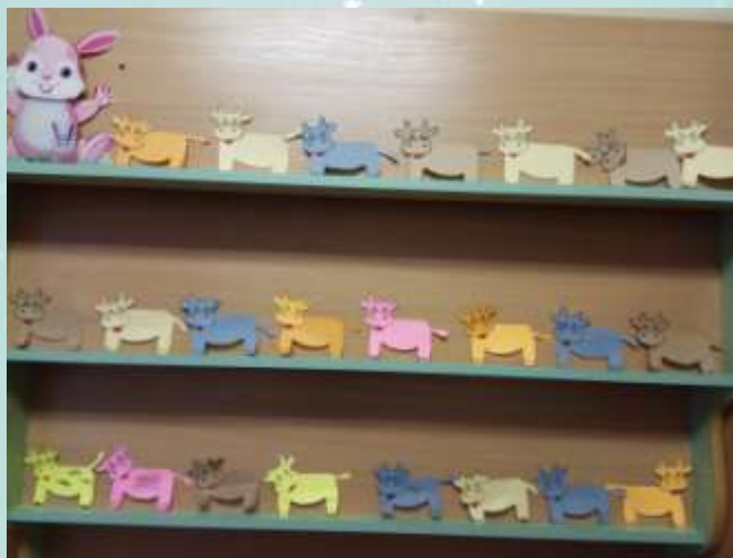
Конструирование: «Символ года – Бычок».