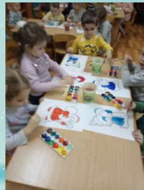
Рисование: «Дед мороз и Снегурочка».