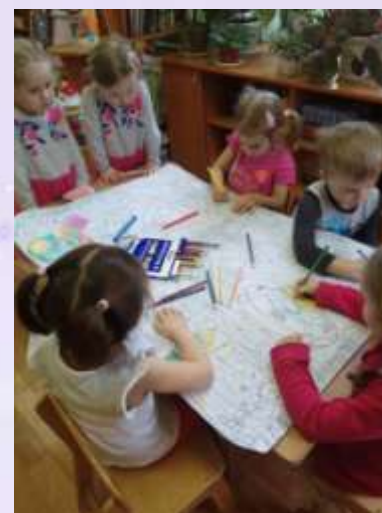
Коллективная работа: «Космическое путешествие».