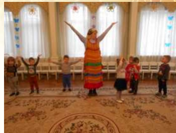
Хороводная игра «Зайнык, попляши»