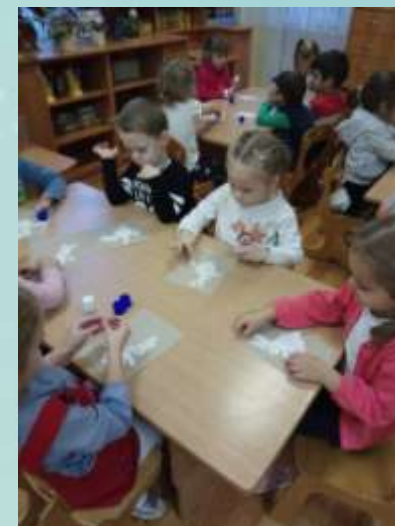
Аппликация: «Зайчик на полянке».